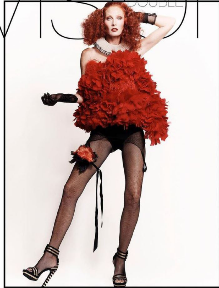
MAGGIE by LUIGI & IANGO