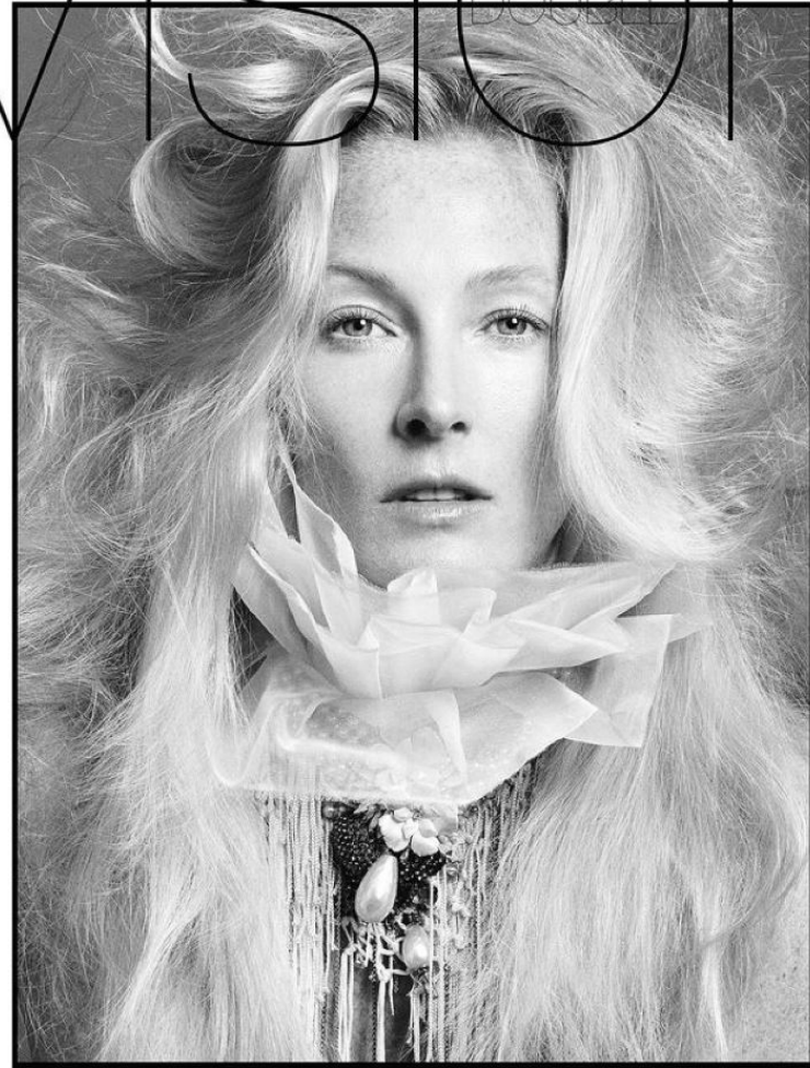
MAGGIE by LUIGI & IANGO