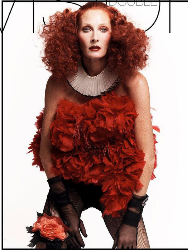
MAGGIE by LUIGI & IANGO